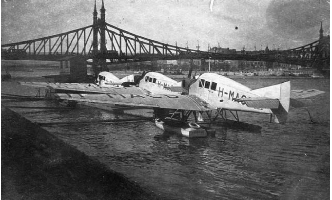
Hidroplánállomás a Szent Gellért tér előtt

A kerület népszerűségét tovább erősítette a közlekedési kapcsolatok fejlődése. A Petőfi híd 1937-es felépítése, a Kelenföldi vasútállomás pályaudvarrá bővítése és a Duna mentén kiépülő iparterület egyaránt elősegítette a népesség növekedését. A kerület érdekessége, hogy 1923 és 1926 között a Szent Gellért térnél hidroplánállomás is működött.