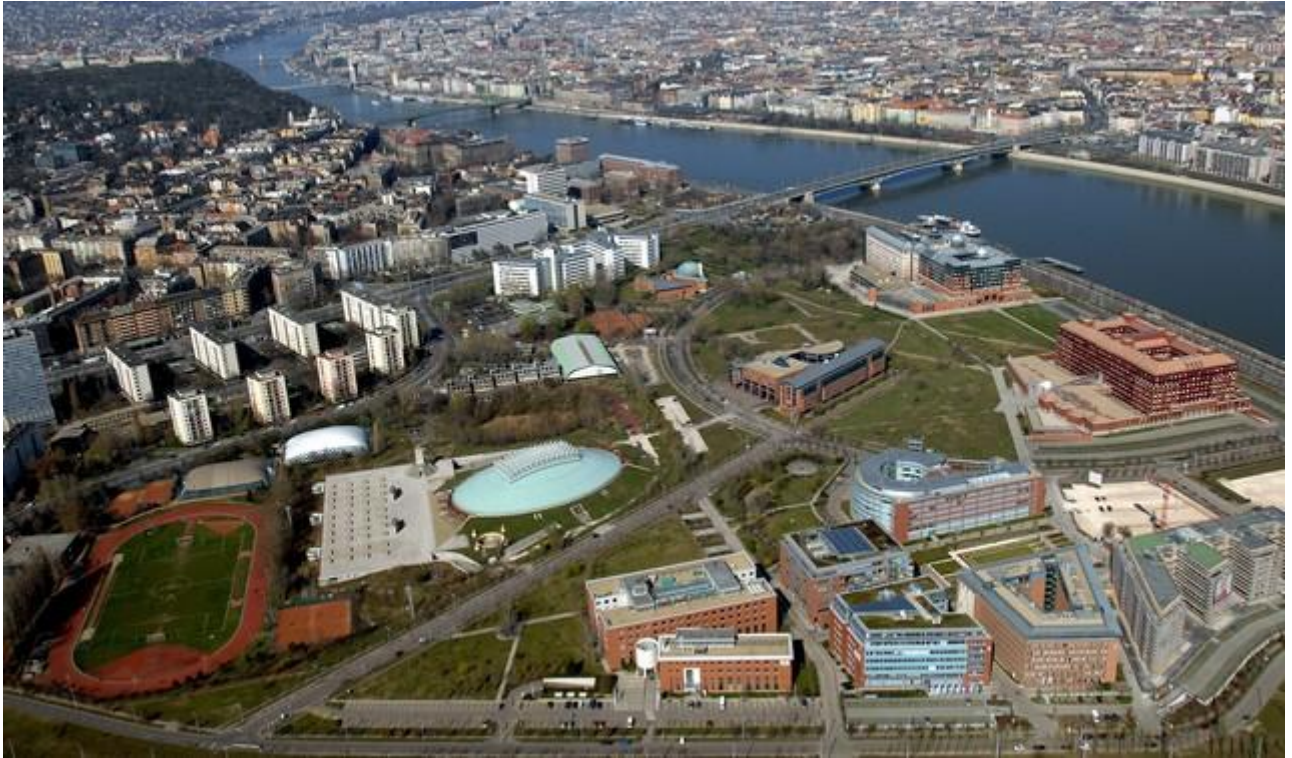
Lágymányos légifotója 2007-ben

Délebbre haladva a kerület egy jellegzetes helyszíne, a Kopaszi-gát található, amit kezdetben az árvízi védekezés céljából építettek. A terület a szocialista iparosítás során jelentősen szennyeződött, így a rendszerváltás után sokáig üresen állt, végül az önkormányzat túladott a telken és 2007-re már magánbefektetők pénzéből készült el a Kopaszi-gát ma is látható környezete.