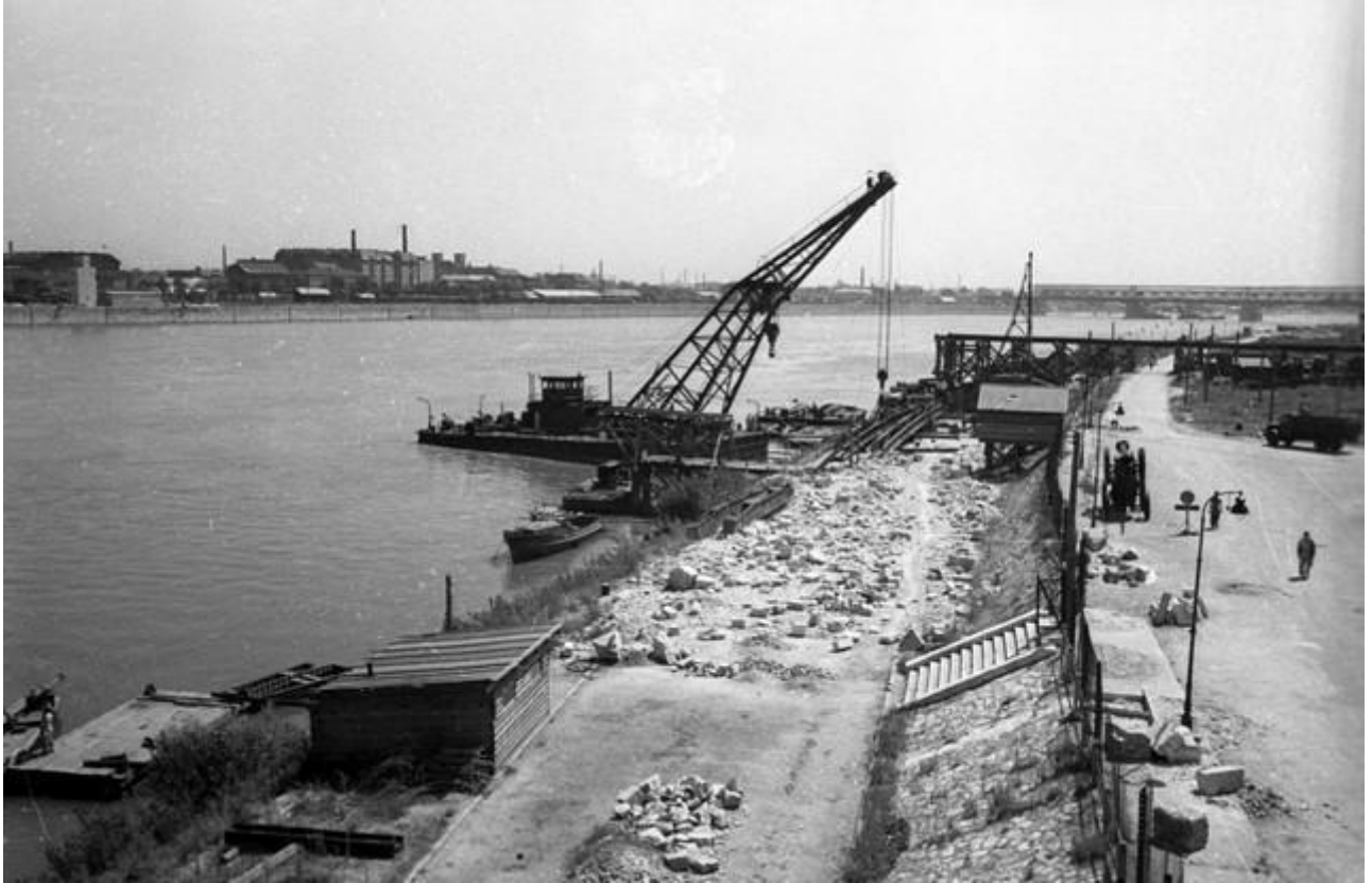
A budai rakpartok építése Lágymányoson 1951-ben

A sokáig üresen álló területre az ezredforduló idején épült fel az ELTE két épülete, valamint az azt követő években a BME újabb épületei is ott kaptak helyet. Szintén itt alakították ki a jelenleg már 100 000 négyzetméternyi irodát magába foglaló Infopark épületegyüttesét is. Emellett olyan sportlétesítmény is helyet kaptak, mint a túskecsarnok és az új lágymányosi uszoda, melyek egy esetleges 2024-es olimpia megrendezésekor kaphatnak nagyobb szerepet.